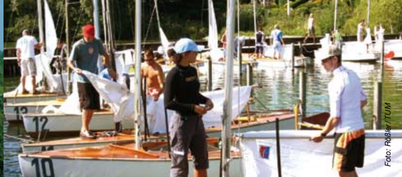
– Klarmachen der Piraten –

Der Einlass ist nur mit einem gültigen Pass oder Ausweis möglich.