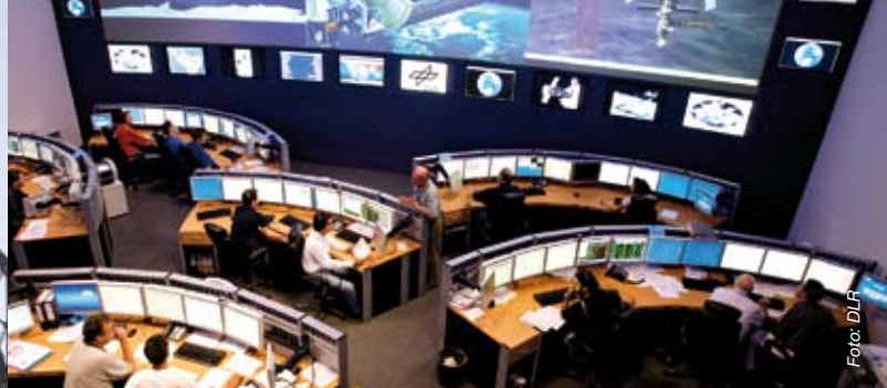
– Columbus Kontrollraum im German Space Operations Center –

Führung: Mirjana Grdanjski (Architekturmuseum der TUM)