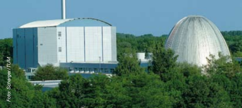
– Forschungsneutronenquelle II und Atomei –