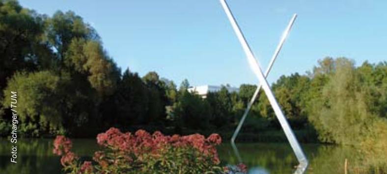
– „Geierstangen“ im Mensaweiler in Weihenstephan –