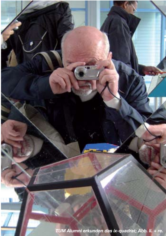
TUM Alumni erkunden das ix-quadrat; Abb. li. + re.