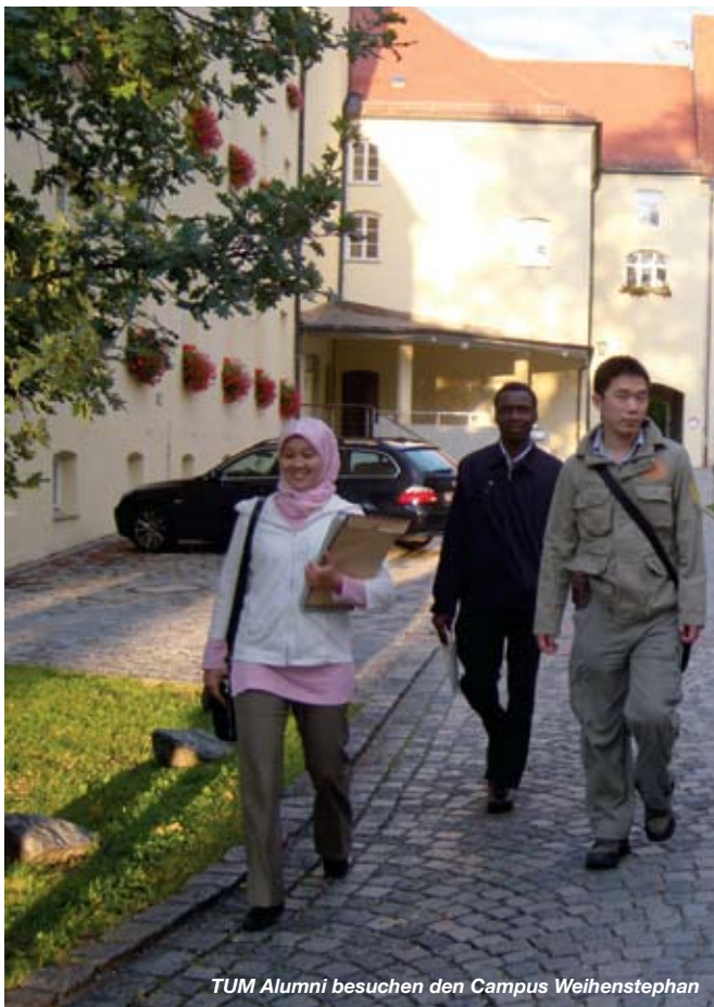
TUM Alumni besuchen den Campus Weihenstephan